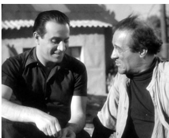
1942 FIÈVRES de Jean Delannoy avec Tino Rossi