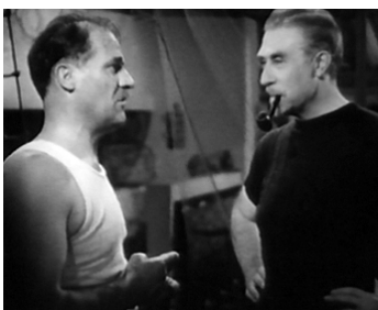
1938 LA VIERGE FOLLE d'Henri Diamant-Berger avec Victor Francen