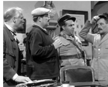
1953 LE BOULANGER DE VALORGUE d'Henri Verneuil avec H. Vilbert, F. Sardou, L. Corne