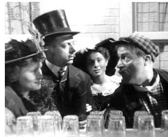
1937 DRÔLE DE DRAME de Marcel Carné avec Marcel Duhamel