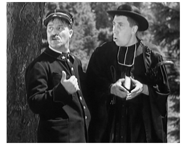
1935 JIM LA HOULETTE d'André Berthomieu avec Fernandel