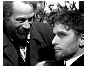
1937 L'HOMME DE NULLE PART de Pierre Chenal avec Pierre Blanchar