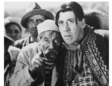
1938 ERNEST LE REBELLE de Christian-Jaque avec Fernandel