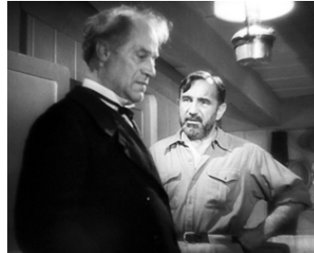
1946 LE BATEAU À SOUPE de Maurice Gleize avec Charles Vanel