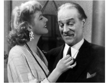
1951 LE GARÇON SAUVAGE de Jean Delannoy avec Madeleine Robinson