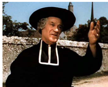
1954 CADET-ROUSSELLE d'André Hunebelle