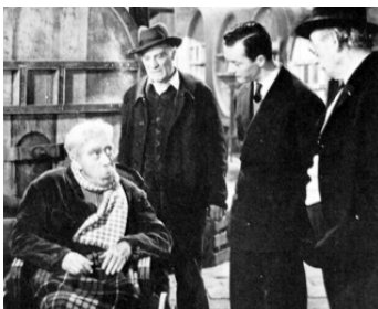
1954 LE MOUTON À CINQ PATTES d'Henri Verneuil avec Fernandel, É. Delmont