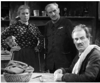
1943 GOUPI MAINS ROUGES de Jacques Becker avec Line Noro, Guy Favières