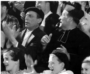
1938 RAMUNTCHO de René Barberis avec Louis Jouvet