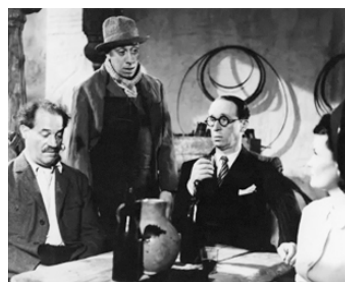
1939 RAPHAËL LE TATOUÉ de Christian-Jaque avec Fernandel, A. Bernard, M. Sologne