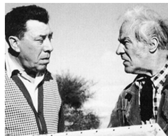
1961 COGAGNE de Maurice Cloche avec Fernandel