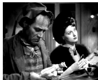
1942 L'ASSASSIN HABITE AU 21 d'Henri-Georges Clouzot avec Sylvette Saugé