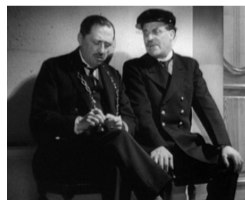
1939 JEUNES FILLES EN DÉTRESSE de Georg Wilhelm Pabst avec Pierre Bertin