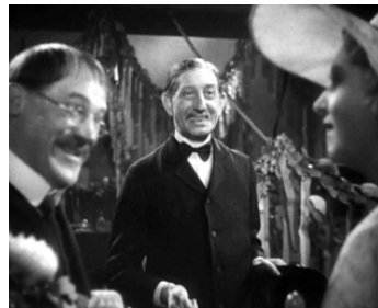
1937 UN CARNET DE BAL de Julien Duvivier avec Marie Bell