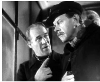
1943 L'HOMME DE LONDRES d'Henri Decoin avec Fernand Ledoux