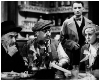
1936 LE CRIME DE MONSIEUR LANGE de Jean Renoir avec J. Beauvais, R. Lefèvre, Florelle