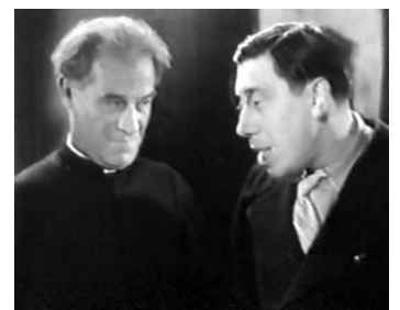
1943 LA BONNE ÉTOILE de Jean Boyer avec Fernandel