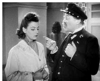
1942 LE JOURNAL TOMBE À CINQ HEURES de Georges Lacombe avec Marie Déa