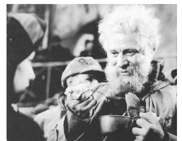
1939 LA CHARRETTE FANTÔME de Julien Duvivier avec Margo Lion