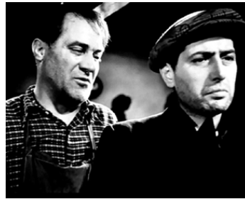
1936 LES MUTINÉS DE L'ELSELEUR de Pierre Chenal avec Maurice Lagrenée