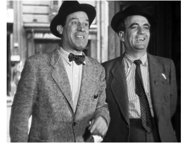
1945 LE ROI DES RESQUILLEURS de Jean Devaivre avec Raymond Cordy