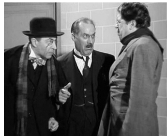
1938 LES DISPARUS DE SAINT-AGIL de Christian-Jaque avec J. Derives, M. Simon