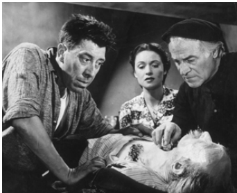
1951 LA TABLE AUX CREVÉS d'Henri Verneuil avec Fernandel, Maria Mauban