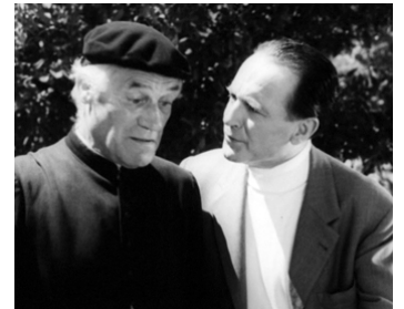
1953 LA ROUTE NAPOLÉON de Jean Delannoy avec Pierre Fresnay