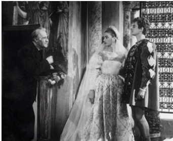
1949 LES AMANTS DE VÉRONE d'André Cayatte avec Anouk Aimée, Serge Reggiani