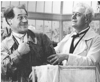
1937 VOUS N'AVEZ RIEN À DÉCLARER ? de Léo Joannon avec Raimu