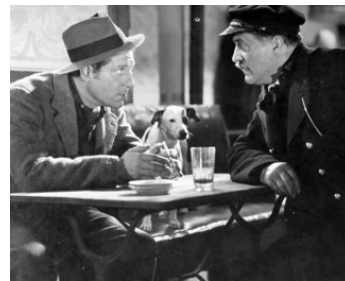
1938 QUAI DES BRUMES de Marcel Carné avec Jean Gabin