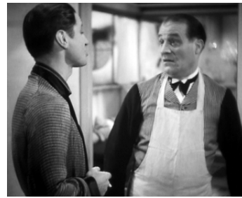
1934 DÉDÉ de René Guissart avec Claude Dauphin